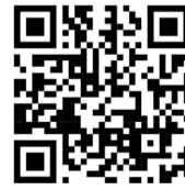
Депутат Т.Е. Никитас