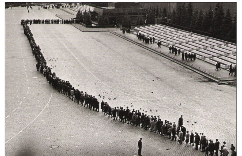
Очередь в мавзолей, 1967 год

То самое будущее настало. За невообразимо короткий срок построили первое в