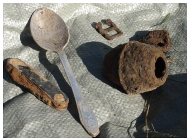
Найденные личные вещи бойца

патроны, командир подпустил врагов как можно ближе и взорвал себя вместе с ними. Он отдал свою жизнь, чтобы спасти около сотни юных, необстрелянных бойцов, оказавшихся в мясорубке той страшной войны».