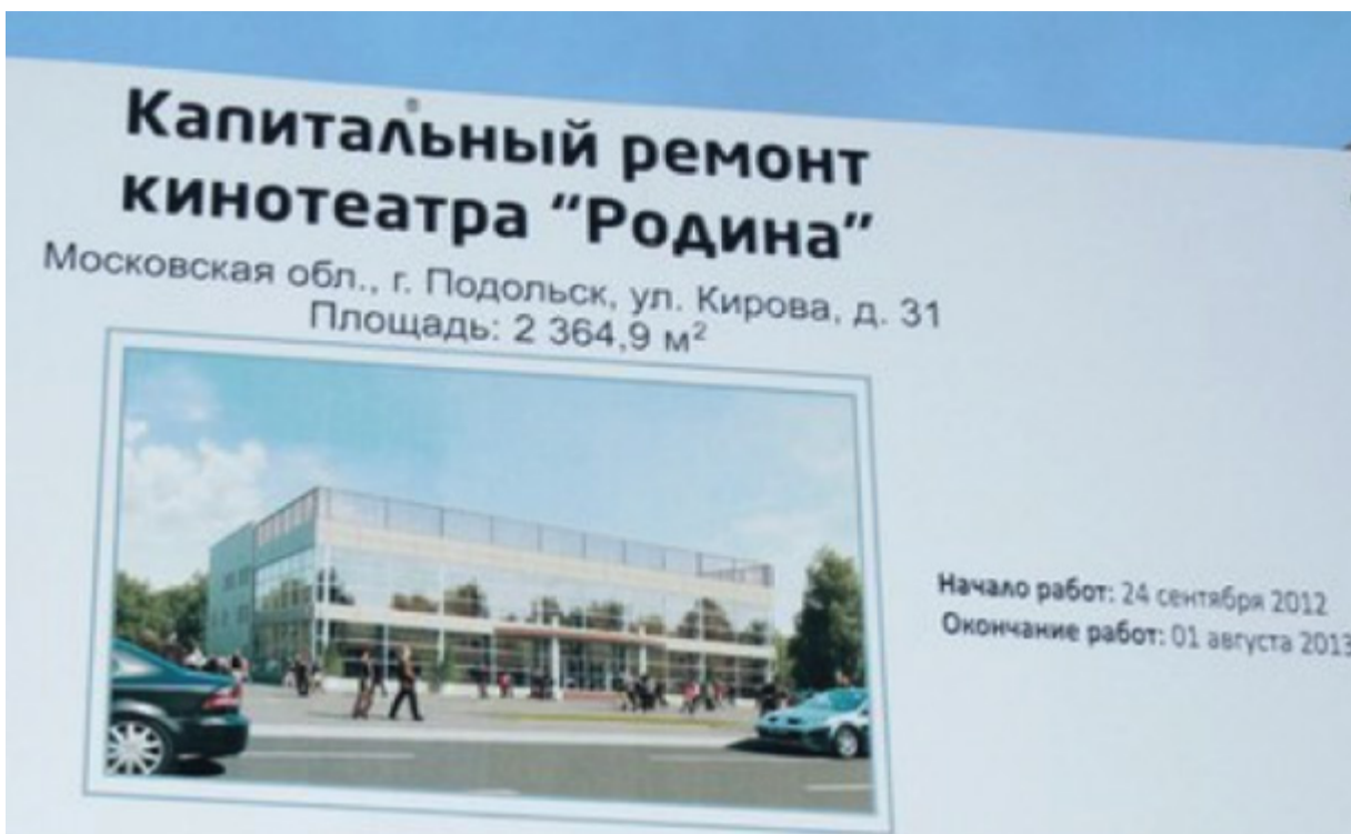
Капитальный или капиталистский?

«Наше Подмосковье». Для этих целей выбрано два земельных участка по адресам: ул. Кирова, д. 23 и ул. Ленинградская, д. 23. Однако волокита по оформлению прав на первый участок затянулась. Начали строительство четырехзального центра на втором участке.