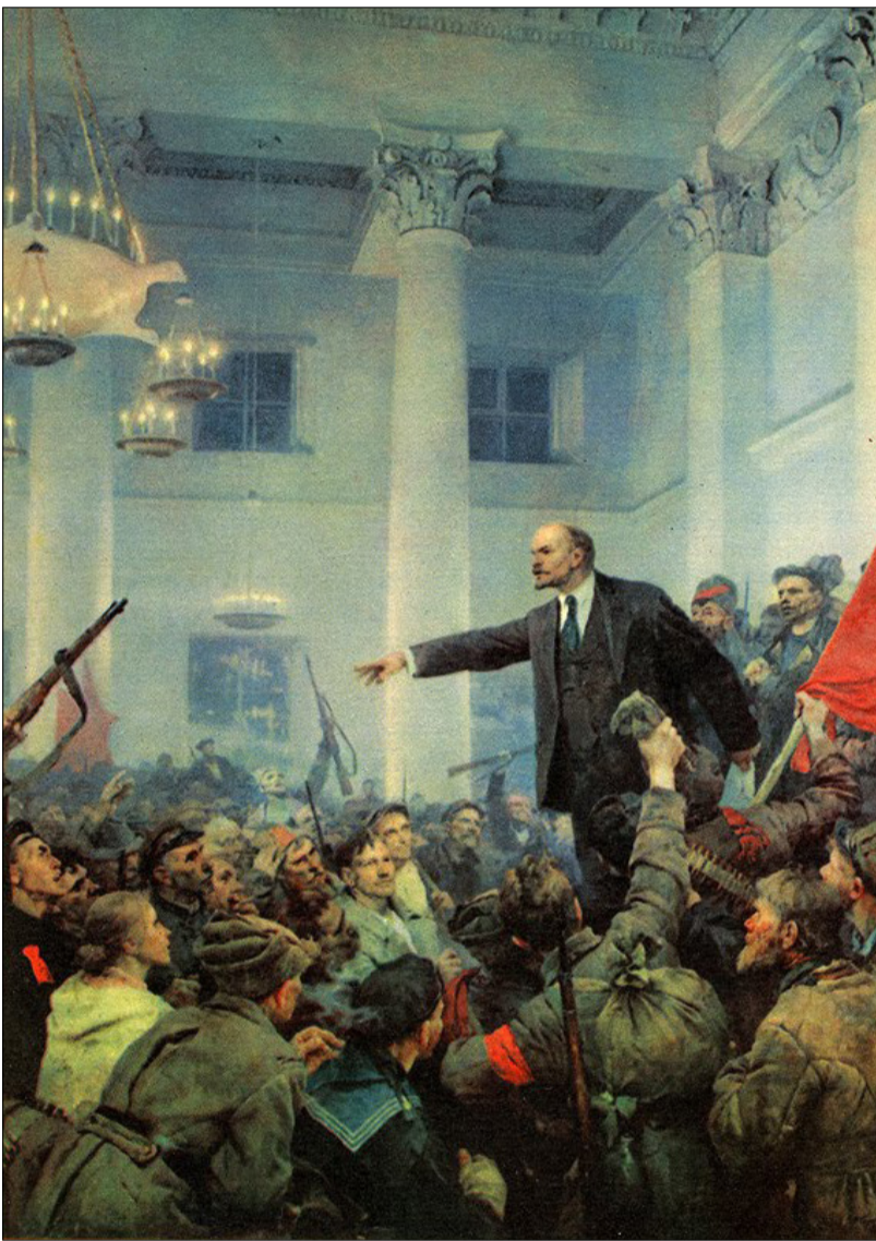
Картина В. Серова «Ленин провозглашает Советскую власть». 1962 год

Владимир Ильич Ленин - главный вдохновитель наших побед, потому что он ассоциируется с борьбой за социальную справедливость, с защитой интересов и прав людей труда!