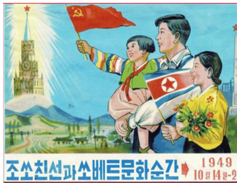
Плакат, посвященный дружбе корейского и советского народов. 1949 год