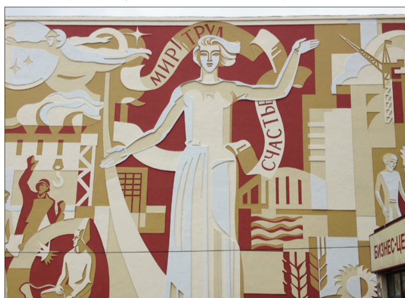
Панно на фасаде кинотеатра

Позже стало известно, что на улице Кирова будут строить «шестизальный многофункциональный культурно-информационный медиацентр». Он участвует в губернаторской программе по развитию сети медиацентров