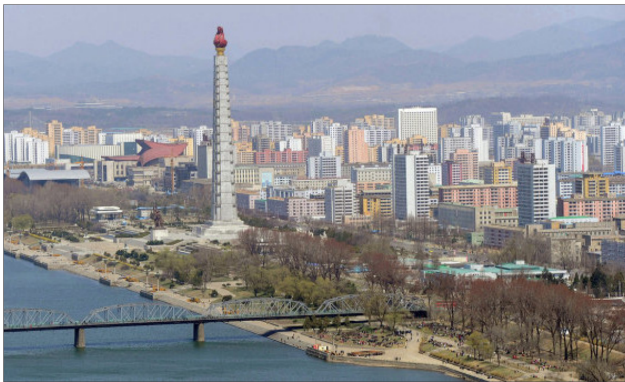
Пхеньян, столица Северной Кореи